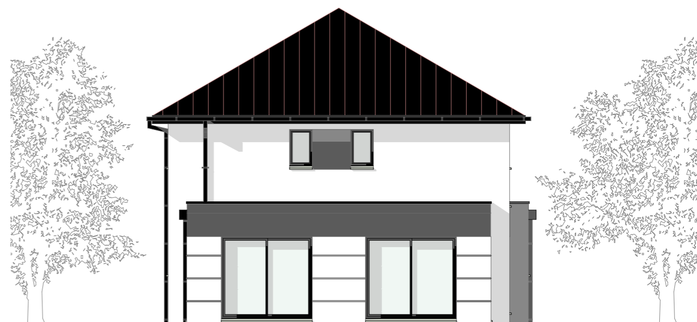
Façade Arrière 1:100