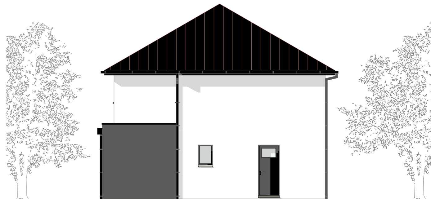
Façade Avant 1:100