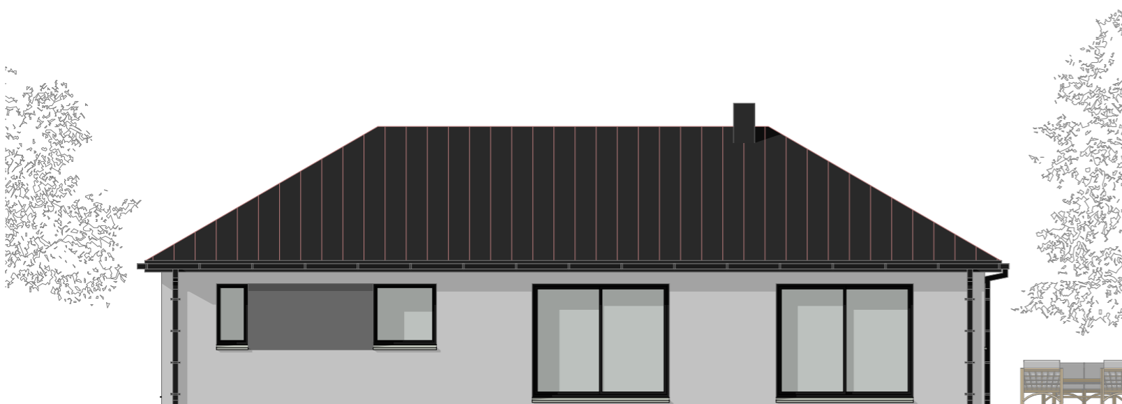
03 - Façade Arriere 1:100