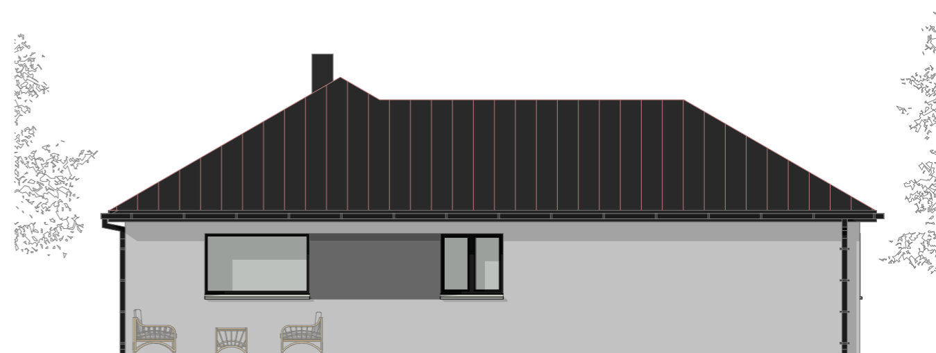
04 - Façade Gauche 1:100