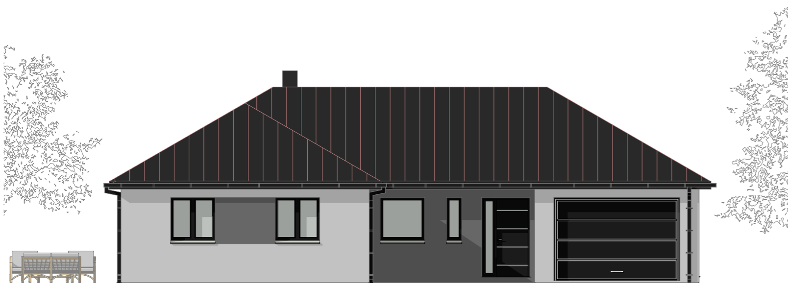
01 - Façade Avant 1:100